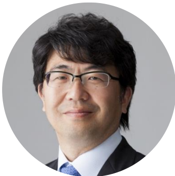
角南篤 ( 日本 ) 政策研究大學院大學副校長

角南篤教授為哥倫比亞大學政治學博士，任職於日本政策研究大學院大學副校長。角南副校長是日本科學技術政策的重要智囊，長期關注相關領域的決策機制與執行成效。目前擔任日本政府重要科技政策顧問，包含內閣府參與 ( 科技創新業務 )、文科省科學技術學術審議會委員、外務省科技外交推進會議委員等要職。近期也參與推動日本重要政策-「Society 5.0」，規劃日本社會數位化及智慧化等重要政策。專長為產業科學以及國家創新政策，發表論文關於先端醫療領域的法規落差與管理、促進能源效率的創新、新興經濟體的可持續性環境發展、農業運用生物科技減緩極端氣候等領域。